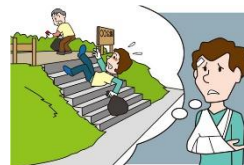
施設の活動中に誤って転落