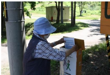
地域支援介護予防センター