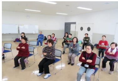
つどいの場サポーター