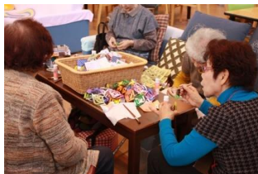
京極町デイサービスセンター