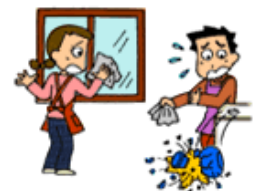
家事援助ボランティア活動で清掃中、誤って花瓶を落として壊した