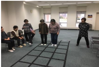
ふまねっと ニュースポーツサロン